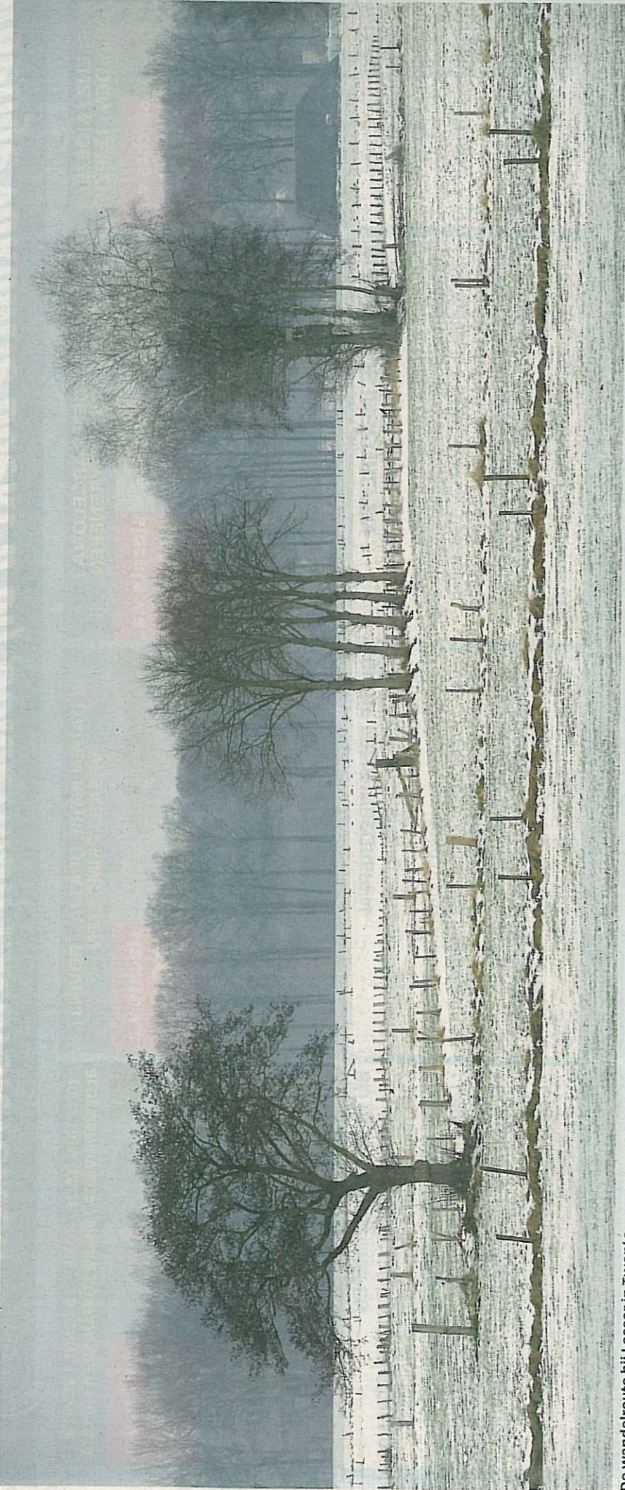
De wandelroute bij Losser in Twente.